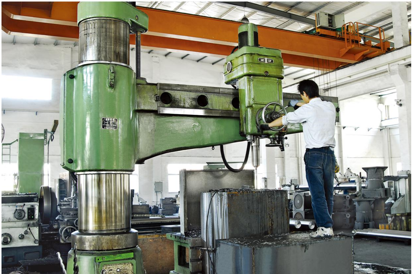
大发泡系列详细介绍