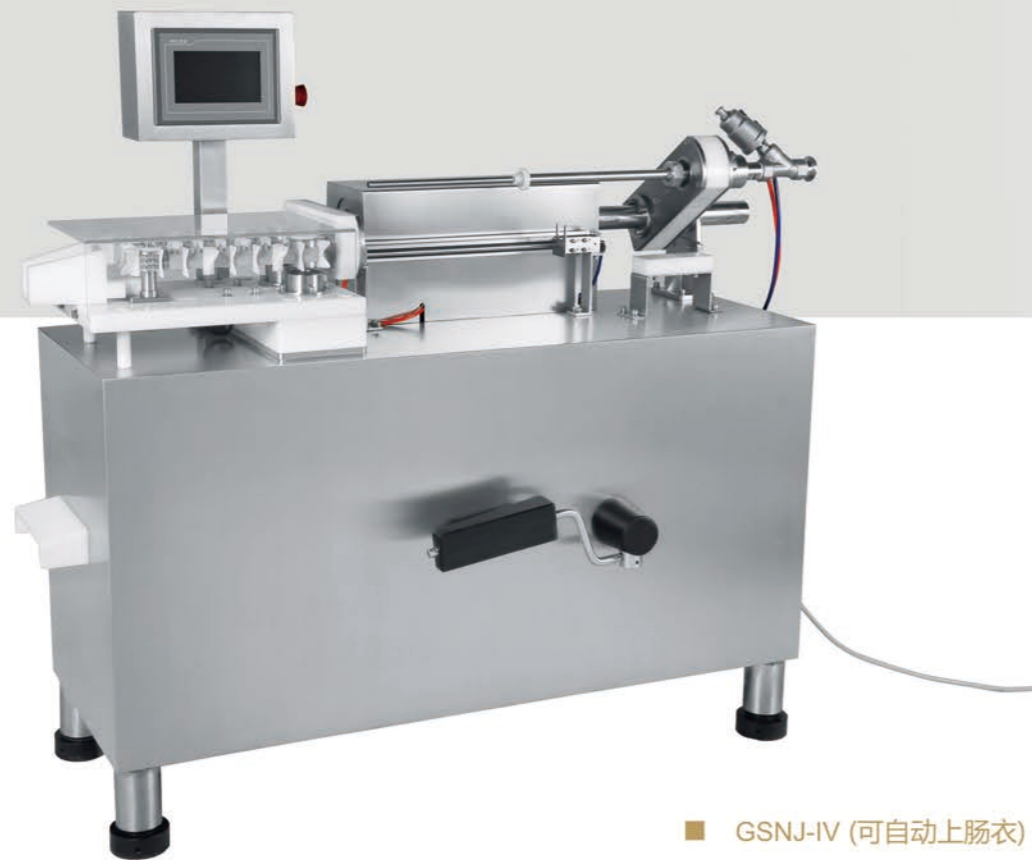
■ GSNJ-IV (可自动上肠衣) Auto Loading Casing